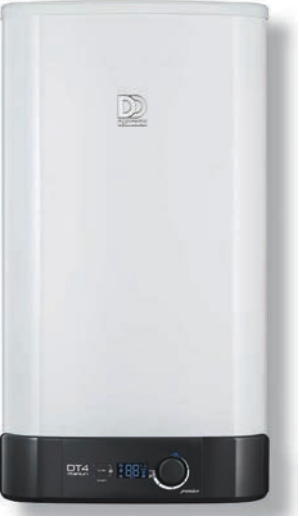
DT4 Titanium Premium

Eco modda DemirDöküm termosifonlar optimum sıcaklık değerinde çalışarak enerji tasarrufu sağlar, kireçlen kireçlenme miktarı azalır ve rezistansın ömrü uzar.