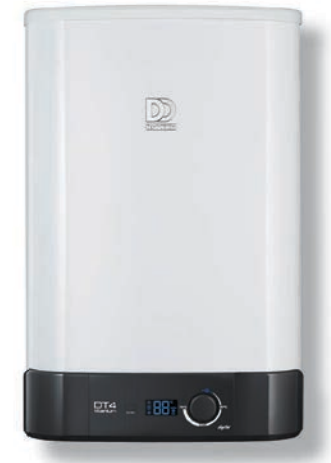
DT4 Titanium Digital