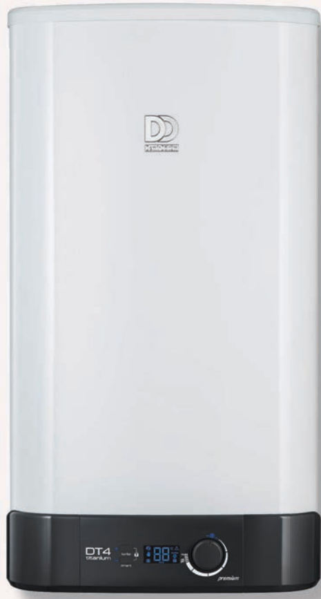
DT4 Titanium Termosifon